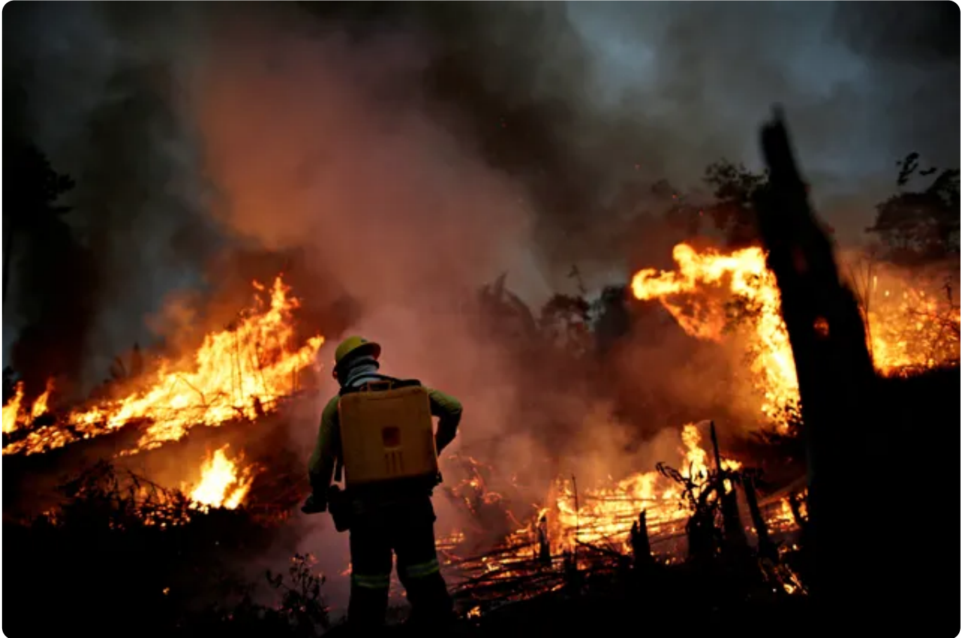
Na foto, membro da brigada de incêndio do Ibama tenta controlar as chamas em um ponto de queimada em Apuí, no Amazonas, no dia 11 de agosto.

"Julho ainda é o início da temporada de queimadas, então não dá para falar muito sobre o que é que tá acontecendo esse ano, ou o que vai acontecer nesse ano, uma vez que a grande maioria das queimadas está ainda por ocorrer", reforçou o pesquisador.