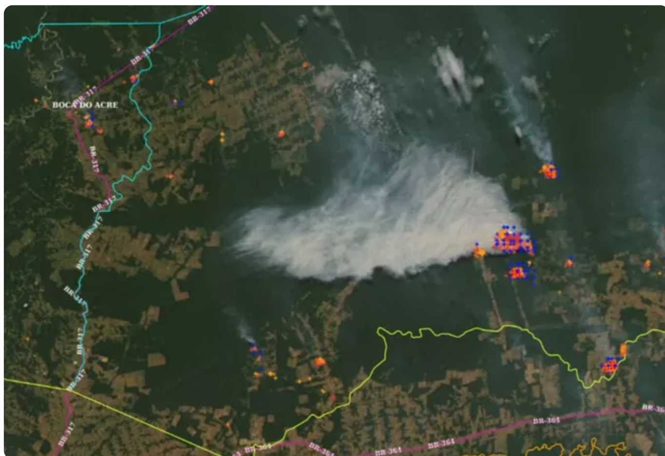
Sistema de monitoramento do Inpe detecta foco de incêndio em Lábrea, no Amazonas.