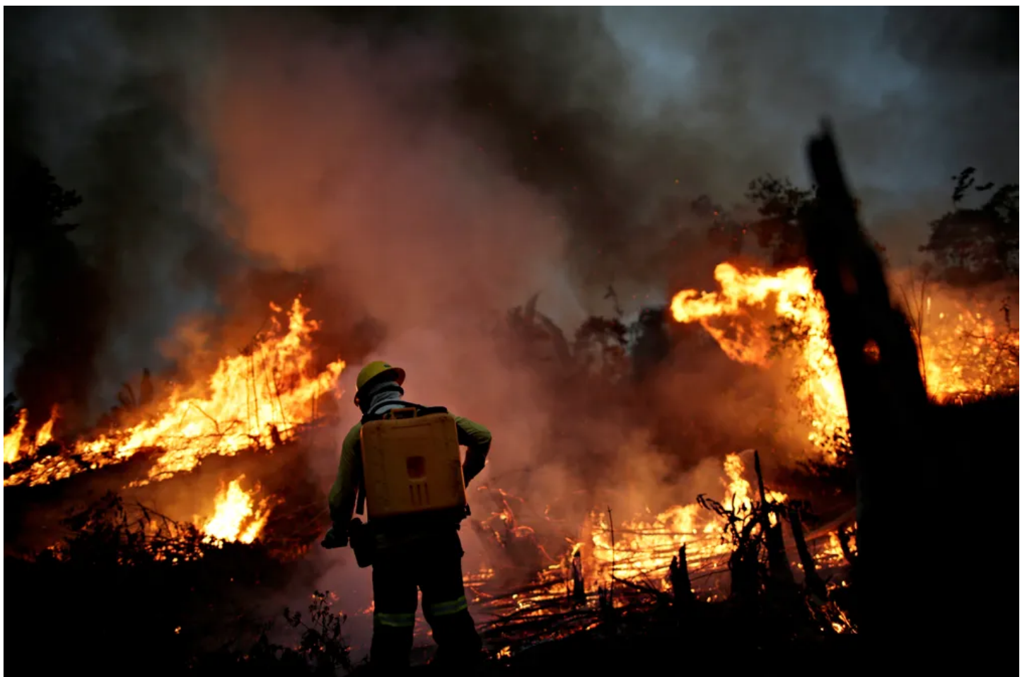
Na foto, membro da brigada de incêndio do Ibama tenta controlar as chamas em um ponto de queimada em Apuí, no Amazonas, no dia 11 de agosto.