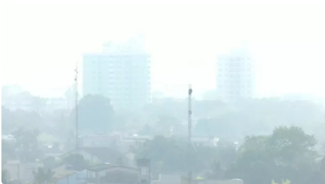
Poluição do ar ficou 10 vezes acima do recomendado