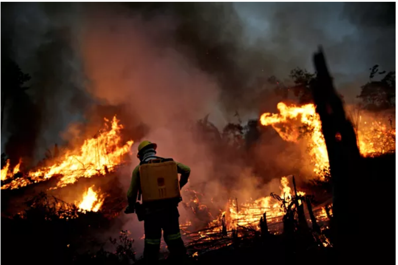
Na foto, membro da brigada de incêndio do Ibama tenta controlar as chamas em um ponto de queimada em Apuí, no Amazonas, no dia 11 de agosto.