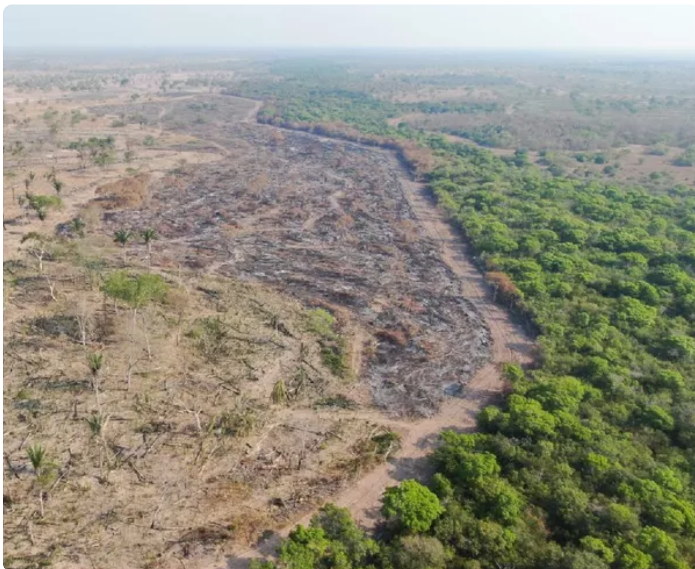
Incêndios já consumiram 42% da vegetação do Pantanal mato-grossense