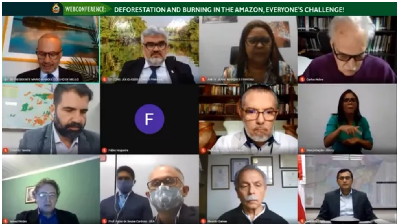
Renomados cientistas participarão de Webconferência ambiental promovida pelo TCE-AM