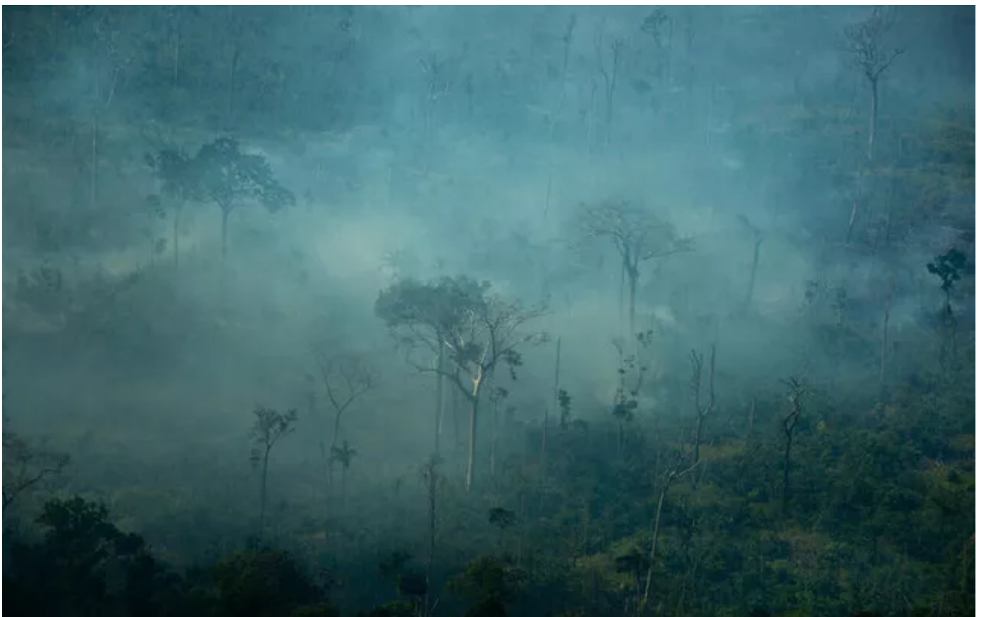
Lábrea, município que fica na fronteira com Rondônia, é o que concentra mais focos de calor em toda a Amazônia Legal.